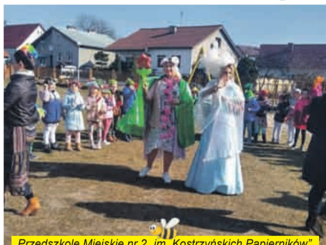
Przedszkole Miejskie nr 2 „im. Kostrzyńskich Papierników”