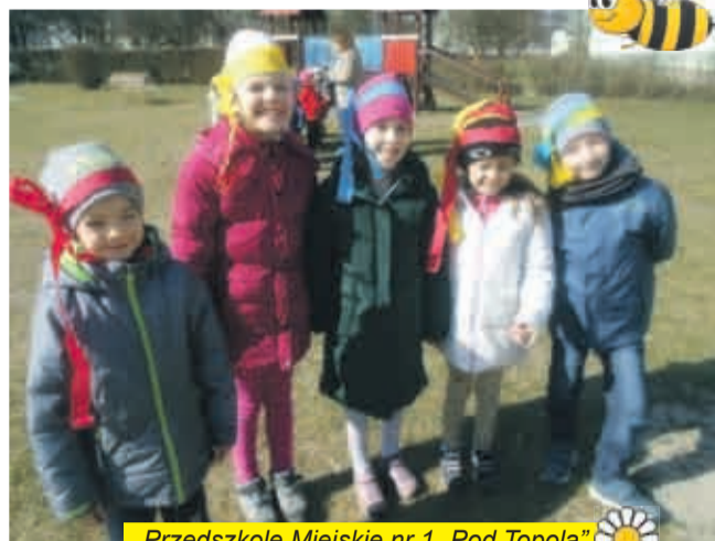
Przedszkole Miejskie nr 1 „Pod Topolą”