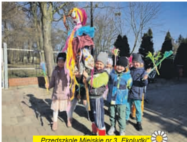
Przedszkole Miejskie nr 3 „Ekoludki”