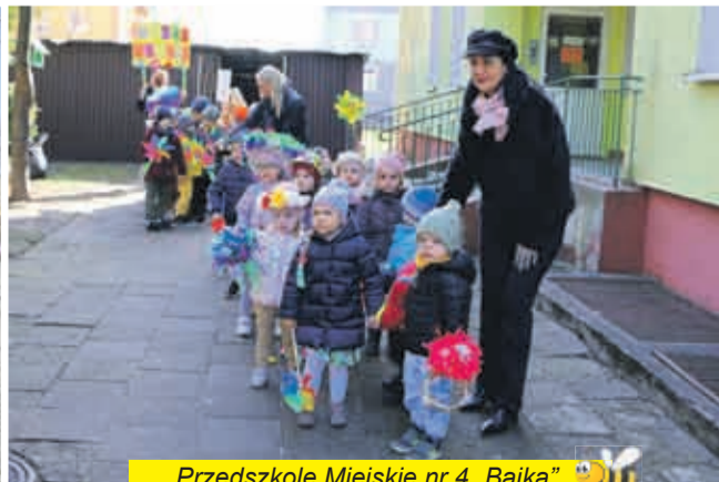
Przedszkole Miejskie nr 4 „Bajka”