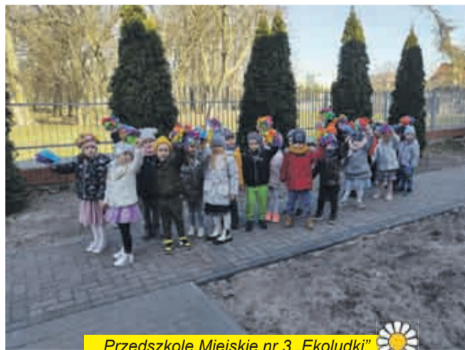
Przedszkole Miejskie nr 3 „Ekoludki”