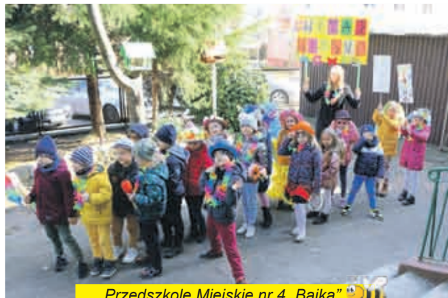
Przedszkole Miejskie nr 4 „Bajka”