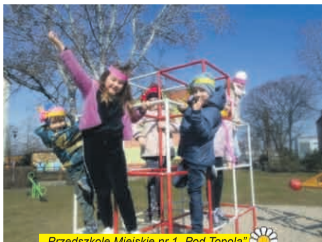
Przedszkole Miejskie nr 1 „Pod Topolą”