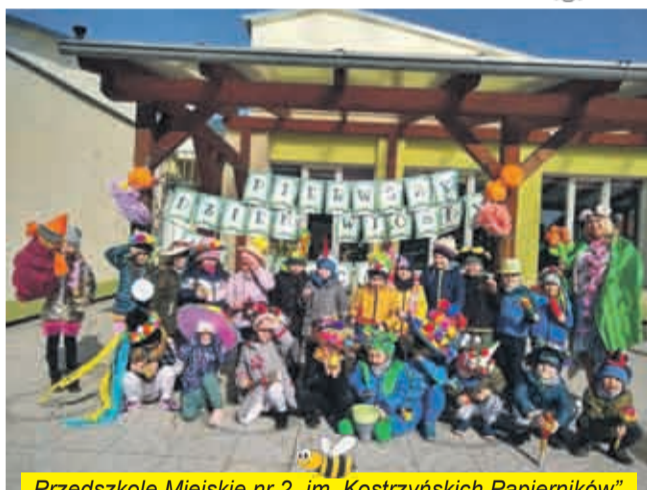
Przedszkole Miejskie nr 2 „im. Kostrzyńskich Papierników”