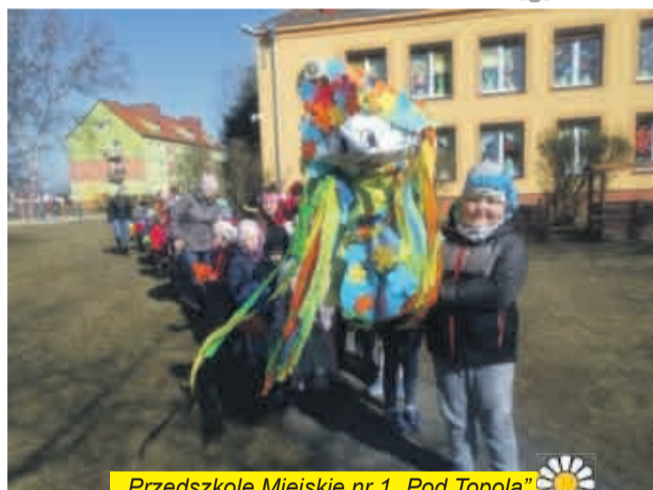
Przedszkole Miejskie nr 1 „Pod Topolą”