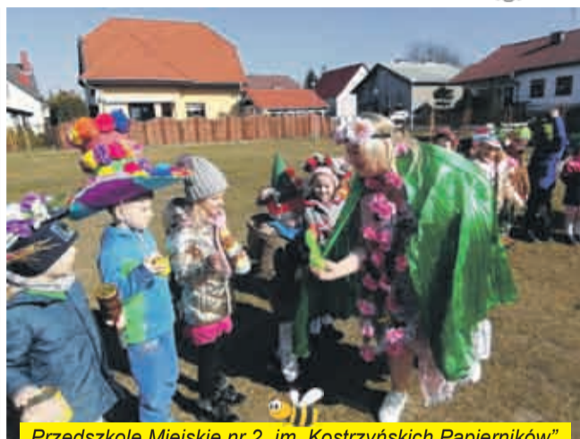
Przedszkole Miejskie nr 2 „im. Kostrzyńskich Papierników”