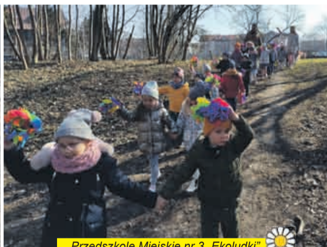
Przedszkole Miejskie nr 3 „Ekoludki”