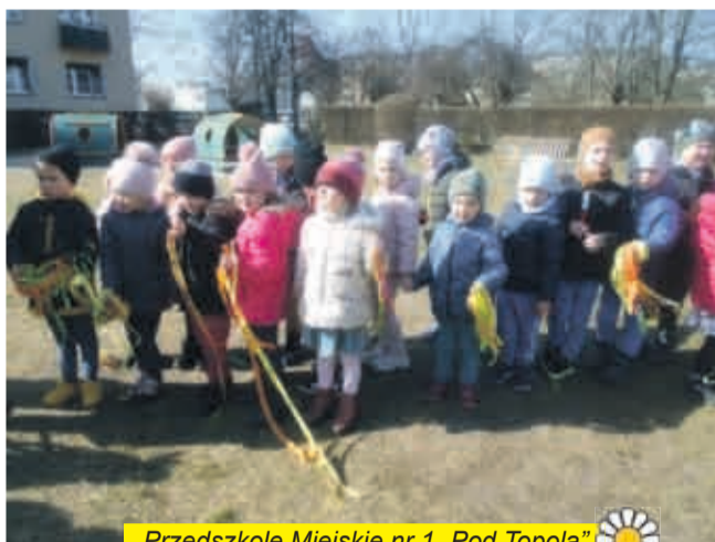
Przedszkole Miejskie nr 1 „Pod Topolą”