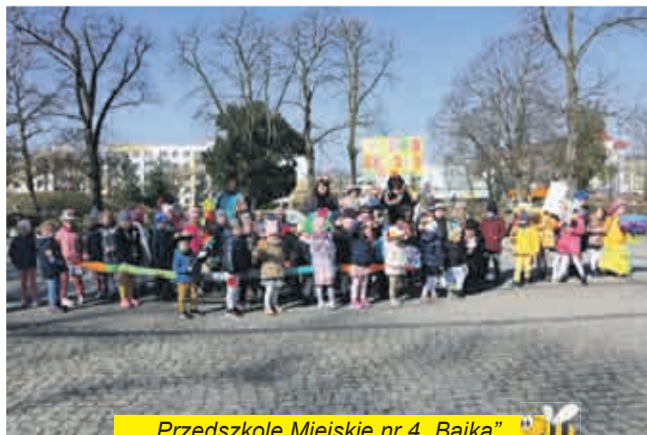
Przedszkole Miejskie nr 4 „Bajka”