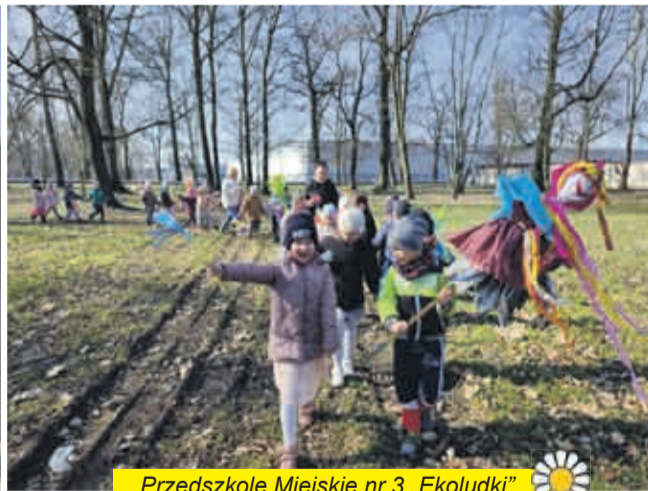
Przedszkole Miejskie nr 3 „Ekoludki”